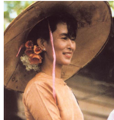
စပယ် နှင်းဆီ